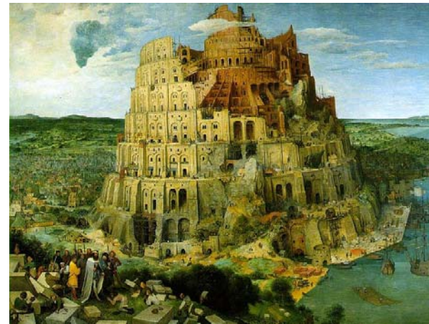
Der Turmbau zu Babel. Pieter Breugel, 1530-1569

In der heutigen Predigt geht es um die Geschichte des Turmbaus zu Babel.