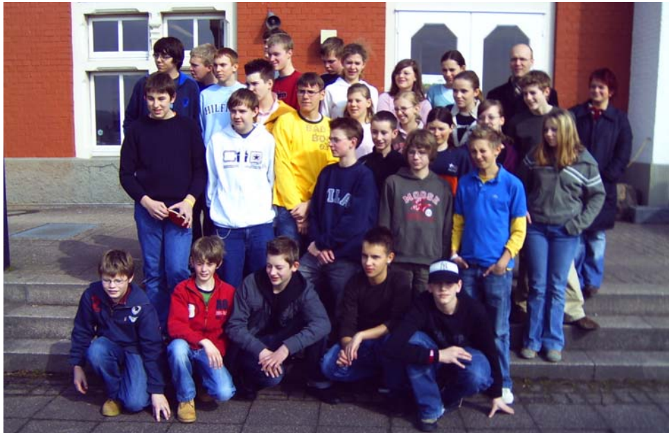
Konfirmandinnen und Konfirmanden 2006

Was aber will die Geschichte uns wirklich mitteilen? Nicht der Turmbau an sich ist die Ursache des einsetzenden Sprachengewirrs, der Strafe Gottes, sondern das dem Bau zugrunde liegende Motiv: die Selbstdarstellung des Bauherren, die Selbstüberschätzung, der eigene Größenwahn, das Stre-